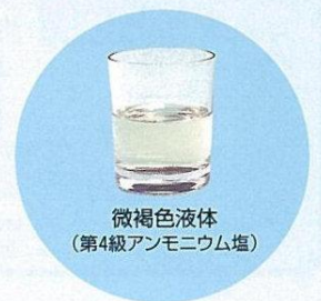
微褐色液体 (第4級アンモニウム塩)